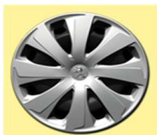
14" kotači XAUREL Active