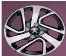
15" kotači THORREN Allure